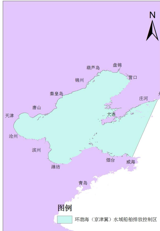
图 3 环渤海（京津冀）水域船舶排放控制区示意图